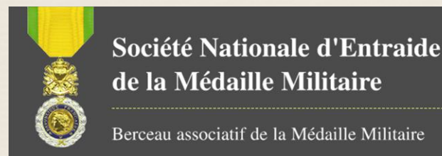
Table Républicaine, Fondée le jeudi 26 janvier 2023